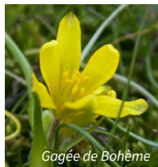
Gagée de Bohême