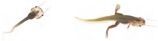
Deux stades de développement successifs du têtard (dessins : Rémi Bouchet, Savenay)

Les têtards, facilement reconnaissables, se déplacent en groupe et en position inclinée (la tête vers le bas). Deux barbillons les font ressembler à de jeunes poissons-chats.