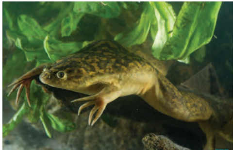
Xénope lisse adulte

L'adulte a un corps aplati dont la taille peut atteindre une douzaine de centimètres. Sa peau est lisse et glissante. Il possède une palmure très développée et les trois premiers doigts des pattes postérieures sont dotés de griffes noires.