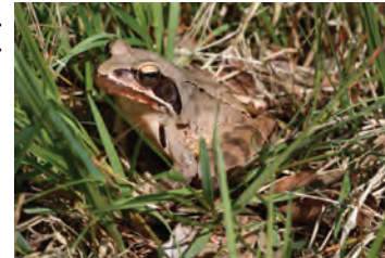
Quelques amphibiens autochtones. 1 : Grenouille verte ; 2 : Crapaud épineux ; 3 : Rainette arboricole* ; 4 : Triton marbré ; 5 : Triton palmé* ; 6 : Grenouille agile