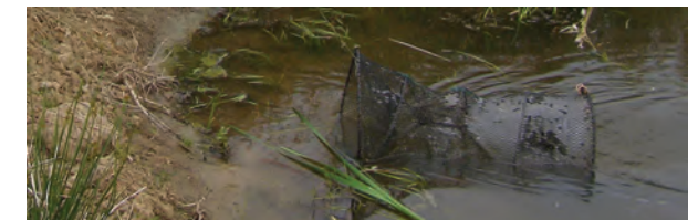
Nasse appâtée et tendue

Reconnu « espèce invasive » au niveau national (2010), le Xénope lisse fait l'objet d'un plan de lutte engagé en 2014 dans le Thouarsais. Ce plan prévoit notamment de piéger les points d'eau à l'aide de nasses appâtées, ce qui permet d'estimer l'extension du territoire colonisé par l'espèce. Mis en oeuvre par un technicien de la Communauté de Communes du Thouarsais, le piégeage est également réalisé par des propriétaires sur leurs points d'eau.