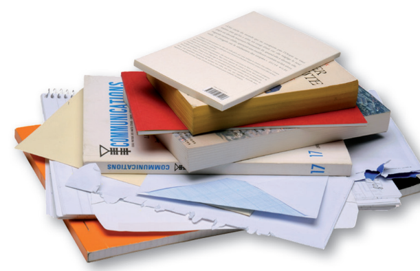
tous les autres papiers

Inutile de les froisser ou de les déchirer, d'enlever les agrafes, les spirales, les trombones, etc. Ils seront retirés lors du recyclage.