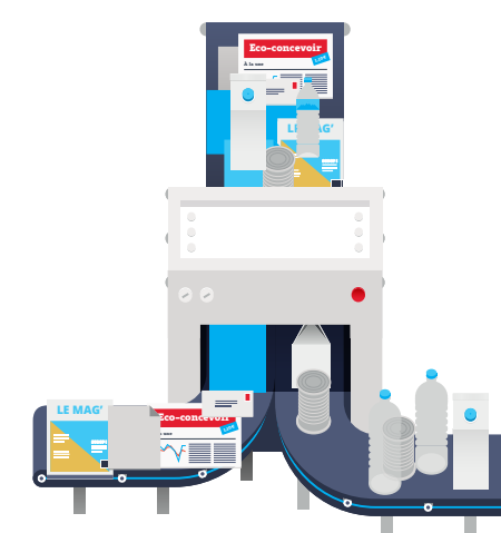
Centre de tri